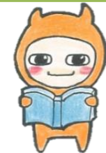
図書情報室が棲家のマスコットキャラクターているるちゃん